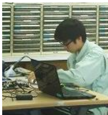
【電子回路組立部門の様子】