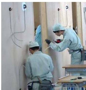
【電気工事部門の様子】