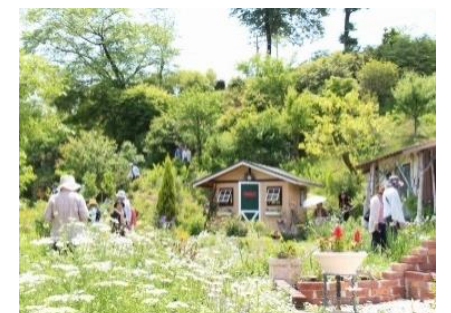
スポットイベント会場イメージ