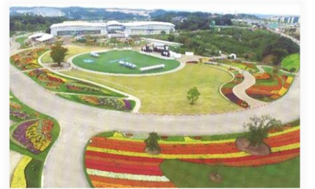
メイン会場イメージ