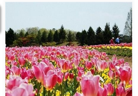
協賛会場イメージ